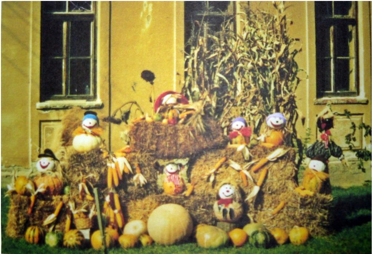
Svake iduće godine redale su se ukrasne kulise u dvorištu škole od kojih neke i predstavljamo.