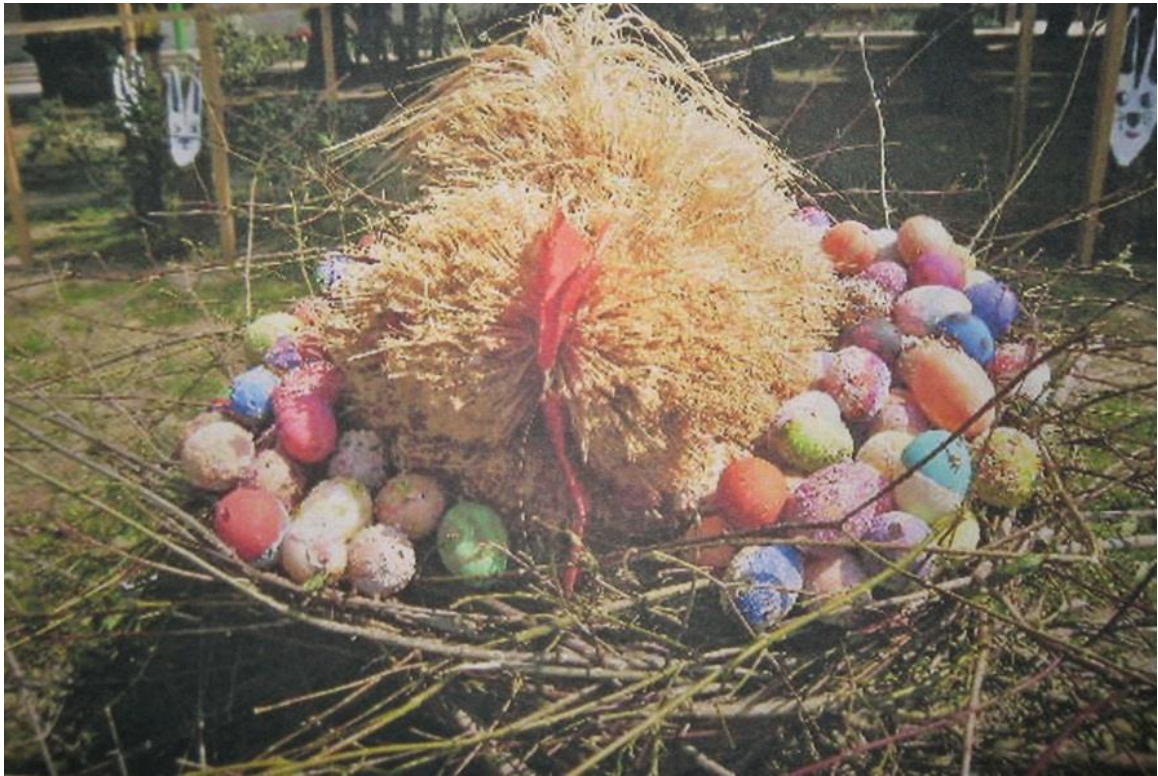
Uskrs iduće godine