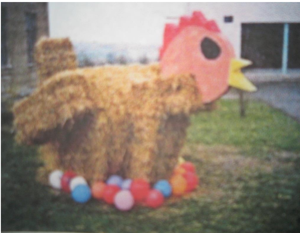
Uskrs u školskom dvorištu