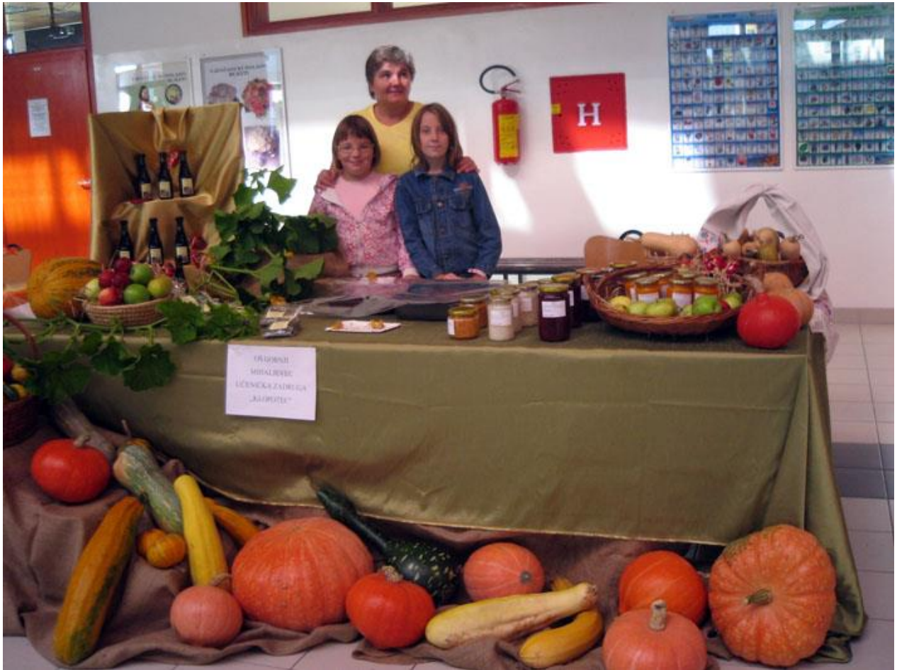
Sajam Ekologije i zdrave hrane u Čakovcu i 1. Bučijada

Pošto smo imali bundeva, sjemenki i ulja rodila se ideja da započnemo rad na još jednom istraživanju. Htjeli smo sakupiti stare recepte za jela od buče i bučina ulja i objediniti ih u prikladnoj knjižici.