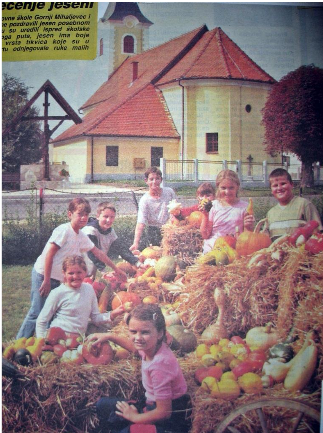
Jesenske kulise ispred škole

ovne škole Gornji Mihaljevec i ne pozdravili jesen posebnom u su uredili ispred školske oga puta, jesen ima boje vrsta tikvica koje su u tu odnjegovale ruke malih