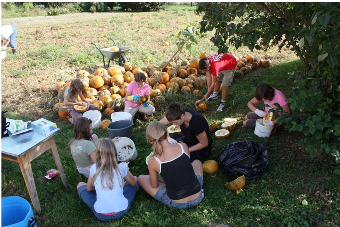
Čišćenje uljnih tikvi golica

2006. godine je izdana monografija „Najljepši školski vrtovi u Hrvatskoj“ u kojoj je predstavljena i naša škola sa svojim školskim vrtom.