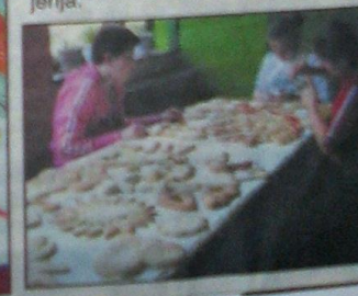
S radionice licitara u školi

U voćnjaku iza škole mladi ekolozi su izradili vrt u obliku puža od starih cigli, nasuli ga zemljom i zasadili začinsko i ljekovito bilje.